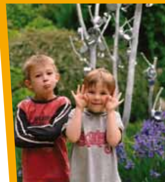
Faire marcher ses 5 sens