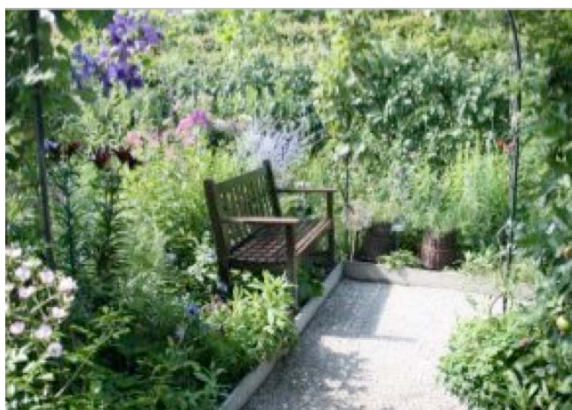
Le « Jardin de la vue » et son camaïeu de bleu

Inspiré du Moyen Age, ce jardin clos se compose d'un labyrinthe végétal sur le thème des cinq sens et de plusieurs « salons de verdure » à thème.