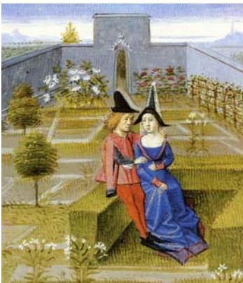
Le Rustican, Pierre Crescens

Sans être une reconstitution, le Jardin des Cinq Sens s'est toutefois inspiré des jardins médiévaux.