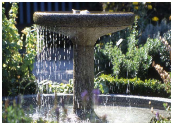
La fontaine du « Cloître »