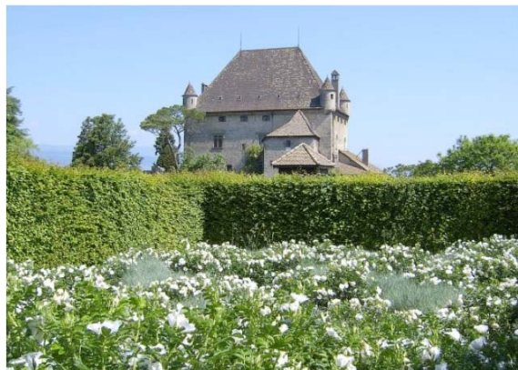
Le « Tissage », roses anciennes blanches et avoines

Le jardin est situé au cœur du village médiéval d'Yvoire qui jouit d'une situation exceptionnelle au bord du Lac Léman , entre Genève et Evian. Yvoire fait partie des « Plus Beaux Villages de France ».